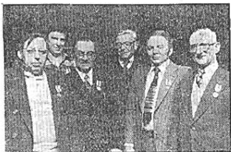
.. Zes van de zeven schutters jubilariissen in Mheer ..