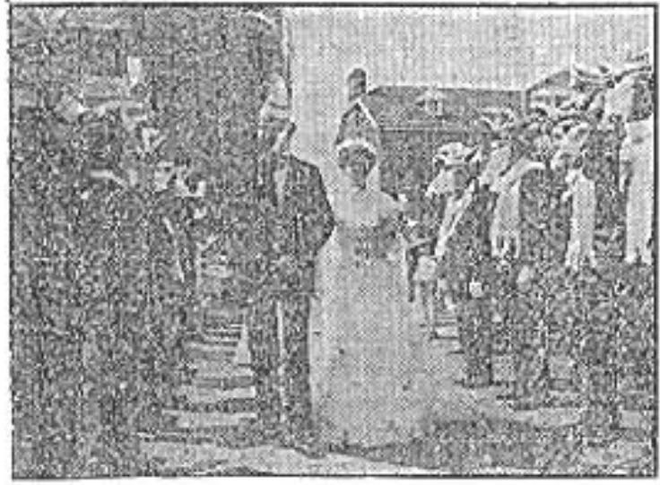
..Carnavals huwelijk in Moelingen..