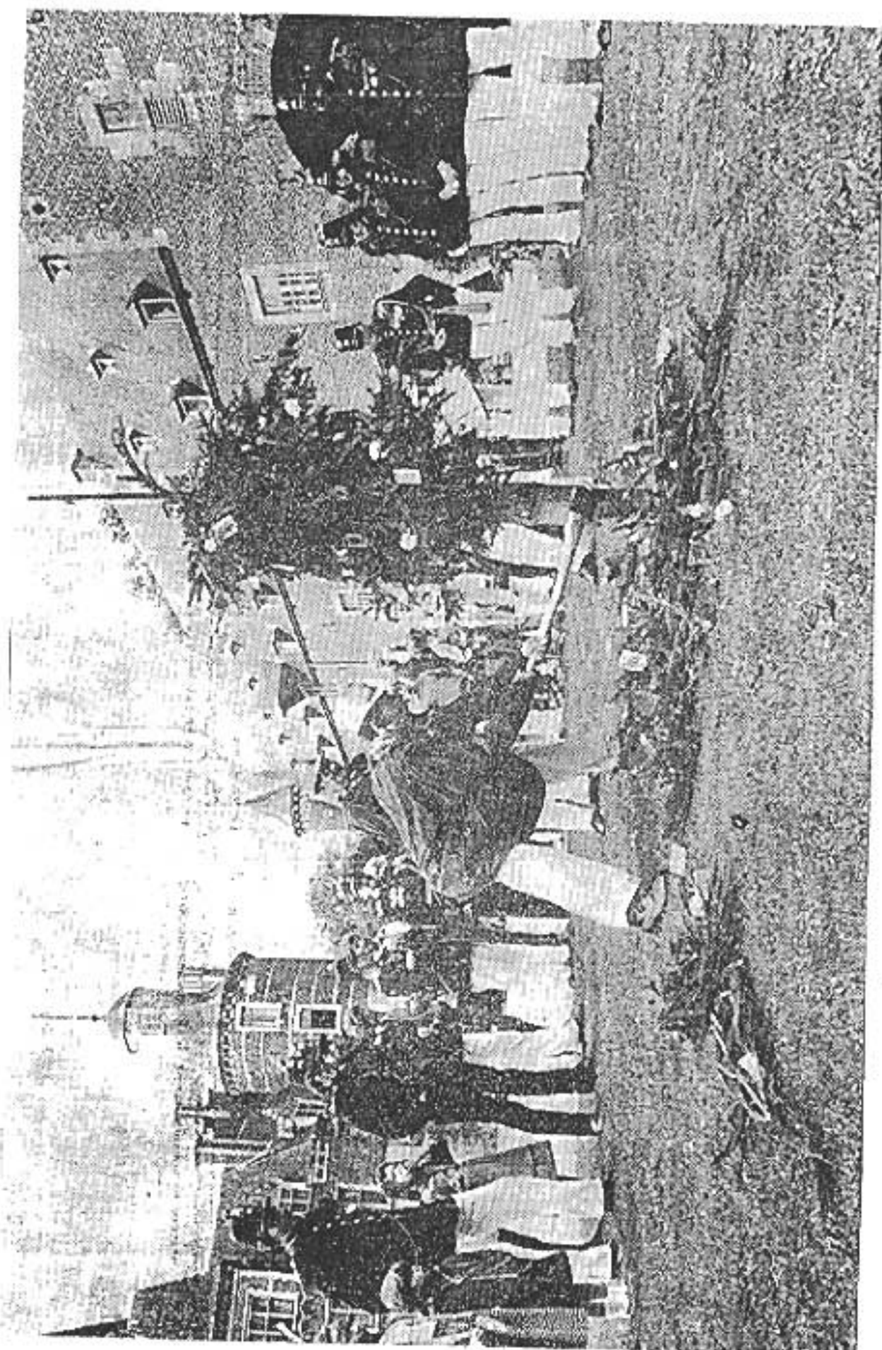
-- "Btelemen" Kaptern 100 "paol"--